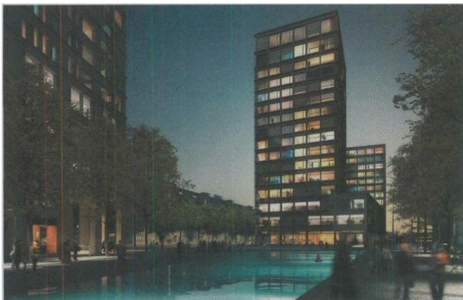
Le chantier de la gare de Zurich donnera le jour à un grand complexe avec 80'000 m 2 de bureaux et de logements.

Le chantier «Europaallee» transformera la gare de Zurich. Inauguré cette semaine, c'est l'un des 80 projets de CFF Immobilier actuellement en cours.