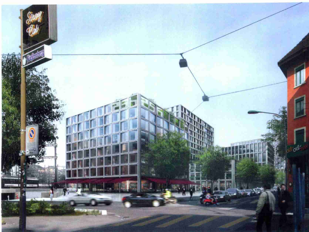
Das Projekt «Trilogie» hat aus Sicht der Jury das Potenzial, ein herausragendes Beispiel für städtebaulichen und architektonischen Umgang mit Nachhaltigkeit zu sein (im Bild: Baufeld H1, Langstrasse).

Die Gebäude des Baufelds H werden nach Minergie P-Eco-Standard mit ökologischen Baustoffen errichtet. Fassaden, Fensterläden und Dächer verfügen über Photovoltaik-Anlagen. Der Betrieb der Gebäude erfolgt CO 2 -neutral. Als Energiequelle für Heizen und Kühlen reichen Sonne, Regenwasser und die Abwärme im Gebäude. ▲