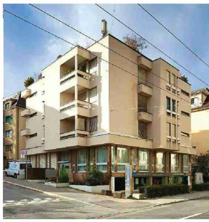
Der Lernmedien-Shop an der Wettingerwies hinter dem Schauspielhaus.