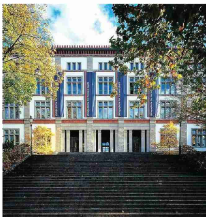
Der Hauptsitz der heutigen PH an der Rämistrasse neben der Universität.