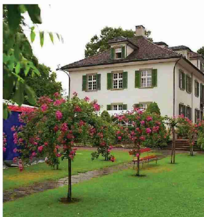
Das Pestalozzianum am Beckenhof mit einer Bibliothek von 138 000 Titeln.